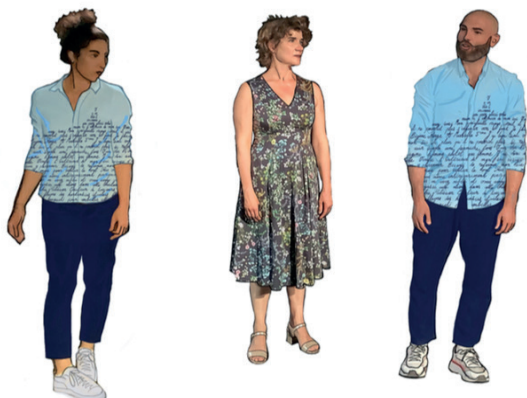
Croquis de Gwladys Duthil, recherche de costumes ©Gwladys Duthil