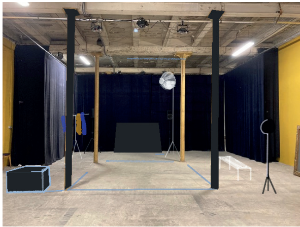
Croquis de Caroline Frachet, recherche scénographique ©Caroline Frachet

L'espace est épuré. Des scotchs bleus dessinent au sol une sorte de ring ou de surface d'exposition. Ils se prolongent sur deux assises à jardin et à cour. L'une d'elles est aussi un support de projection vidéo.